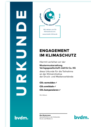
Die Urkunde bestätigt die Mitgliedschaft in der Klimainitiative.

Für jedes Produkt, das klimaneutral gestellt wurde, erhält der Kunde eine Urkunde. Damit kann er jederzeit belegen, dass seine Produkte klimaneutral produziert werden. Mitglieder der Klimainitiative werden auf der Website klima-druck.de präsentiert. Einkäufer finden hier schnell die klimafreundliche Druckerei in ihrer Nähe.