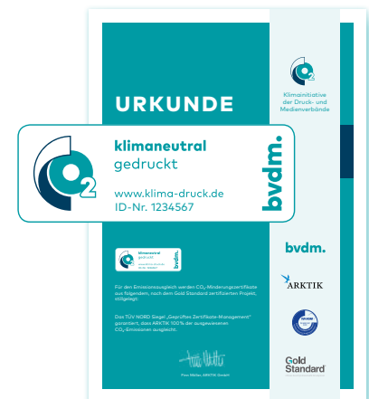
Klimaneutral-gedruckt-Logo und Urkunde mit individueller Identifikationsnummer.