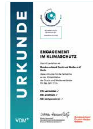
Die Urkunde bestätigt die Mitgliedschaft in der Klimainitiative.

Für jedes Produkt, dessen Emissionen ausgeglichen wurden, erhalten Kund:innen eine Urkunde als Nachweis für den Beitrag zum Umweltschutz. Mitglieder der Klimainitiative werden auf der Website klima-druck.de präsentiert. Einkäufer:innen finden hier schnell die klimafreundliche Druckerei in ihrer Nähe.