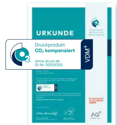
Urkunde und Logo für Druckprodukte, deren Emissionen kompensiert wurden